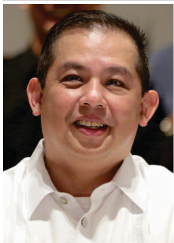
Rep. Martin Romualdez