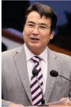
Sen. Bong Revilla

mastermind ng impeachment kay VP Sara ay malalim ang pagmumuni-muno dahil sa planong big rally ng Iglesia Ni Cristo (INC) at Kingdom of Jesus Christ (KOJC)?