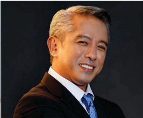
DILG Sec. Jonvic Remulla

bansa bilang police attaché at walang tauhan, nandun sila upang makipag-ugnayan sa kanilang katapat na opisyal.