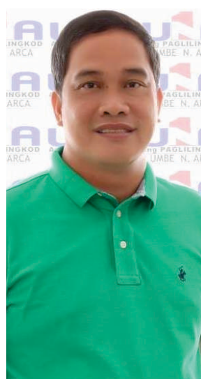
Mayor Umbe Arca