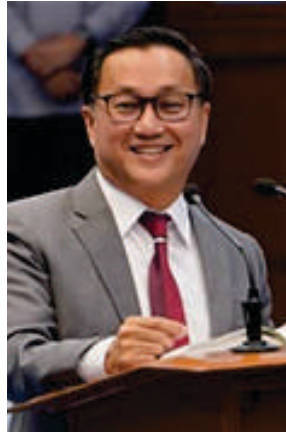
Sen. Francis Tolentino

Sa koreo o inaabisuhan sa email o telepono ang tatanggap ng ready to encash na tseke.