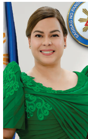
VP Sara Duterte

Una rito, sinabi ni P B B M na hindi makikinabang ang mamamayang Pilipino sa inihang petisyon sa