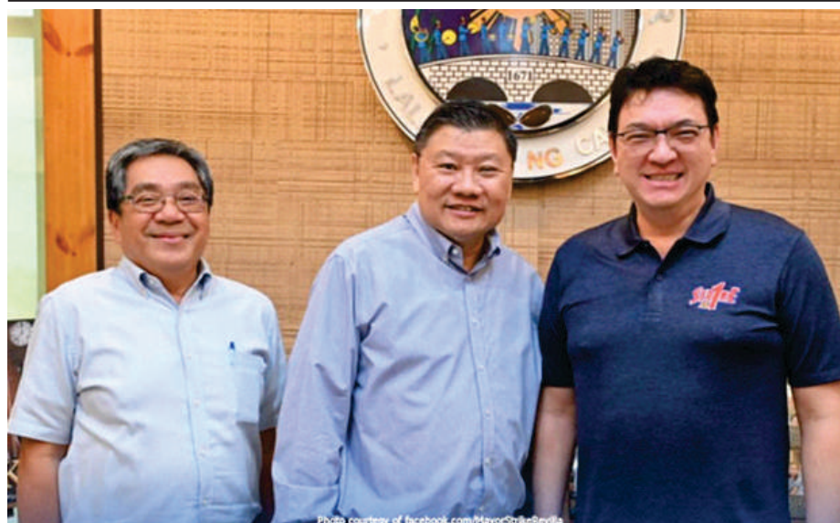
TRABAHO sa Bacooreno: Sa bubuksang bagong S&R branch sa darating na Seyembre, nagkasundo ang management nito na uunahing tanggaping kawani ang mga kuwalipikadong residente ng Bacoore City.

Idiniin ng heneral, na ang PNP ay mananatiling tapat sa tungkuling maglingkod at magbigay ng proteksiyon sa bayan. /DENNIS ADLAWAN