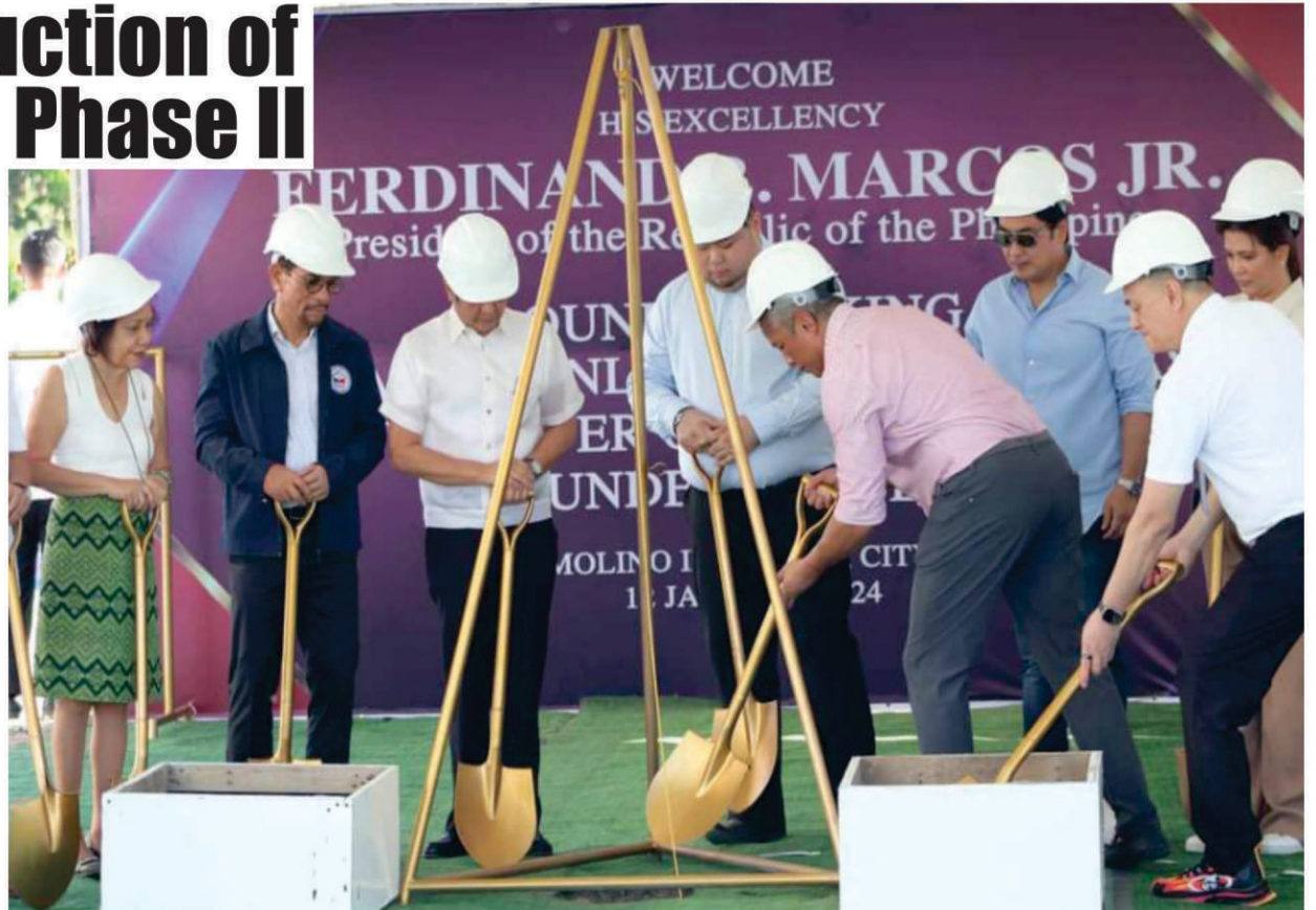
President Marcos is shown leading the groundbreaking ceremony of the Ciudad Kaunlaran housing project of the National Housing Administration (NHA). With the chief Executive were NHA officials and the city government officials led by Mayor Strike Revilla.

The NHA -- an attached agency of the DHSUD -- said that it committed to its goal of building more than a million houses and create sustainable communities in different parts of the country.