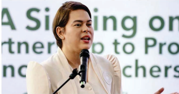
Vice President-DepEd Sec. Inday Sara Duterte

Rerebisahin din ng task force ang umiiral na polisiya ng programa upang matiyak na makatutulong sa pagusbong at pagpapalakas ng