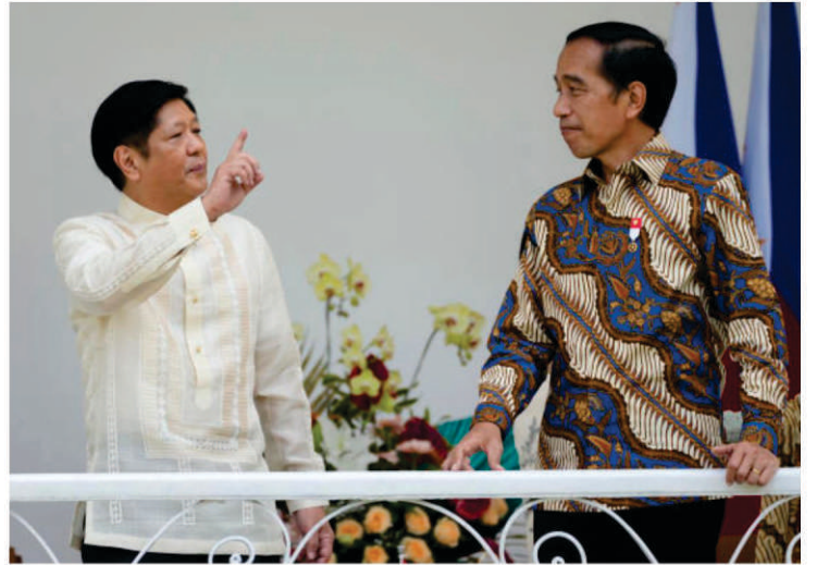
President Ferdinand Marcos at Indonesian President Joko Widodo.

Nangyari ang MOA sa loob ng tatlong araw na opisyal na pagbisita ni Indonesian President Joko Widodo sa Pilipinas, sa imbitasyon ni Presidente Ferdinand 'Bongbong' Marcos. Sundan sa p.2