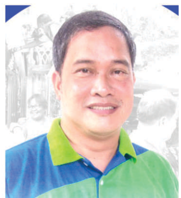
Mayor Lawrence "Umbe" Arca

ay upang maiwas sila sa ingay ng mga paputok at ingay sa paligid.