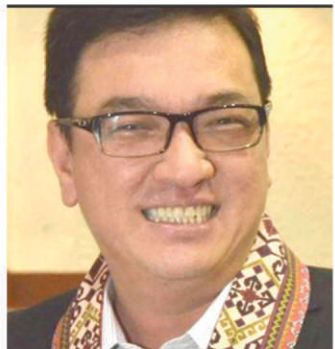
Mayor Strike Revilla

Sabi ng bise alkalde: "et's all welcome the New Year peacefully."