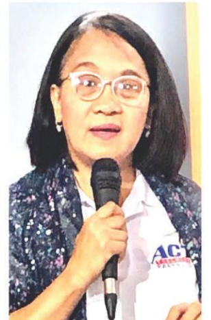
Rep. France Castro

"Kaisa po ako ng PCO dito sa program na ito o project na proposed digital media and information literacy campaign at