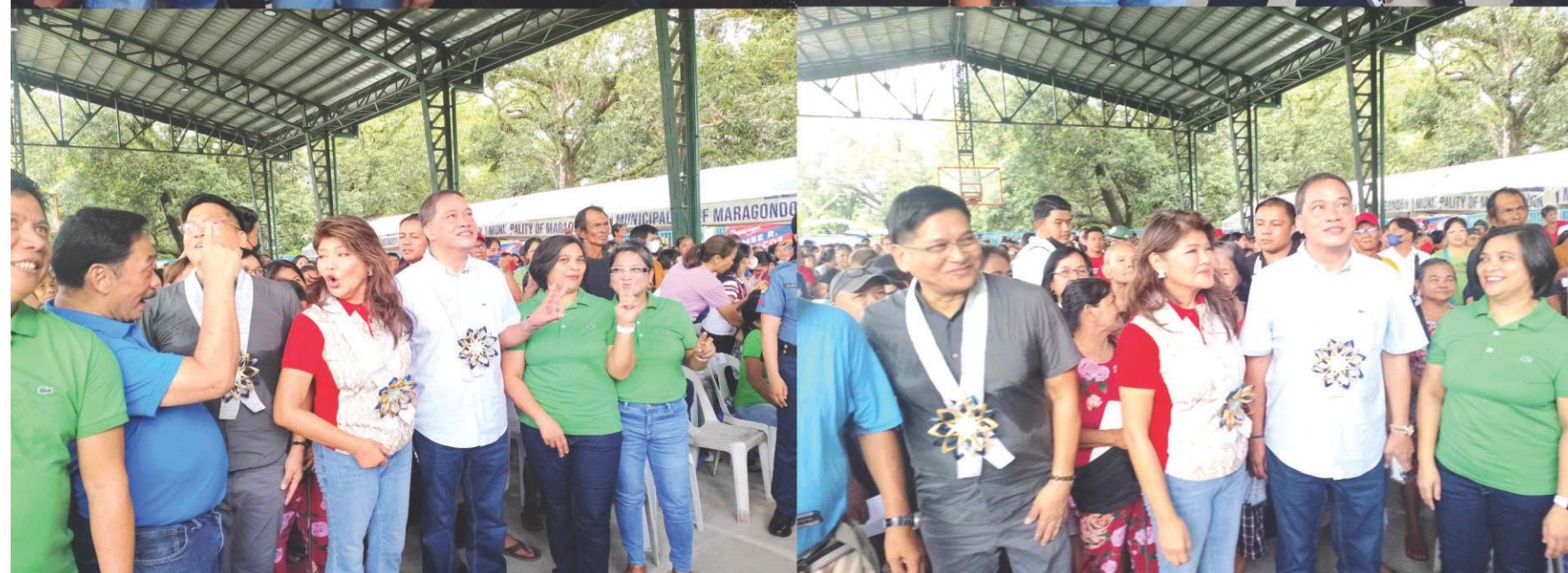
Masayang tinanggap at pinasalaman ni Mayor Umbe Arca ang ayudang ipinamigay ni Sen. Imee Marcos para sa mahihirap na residente at pamilya ng bayan ng Maragondon.