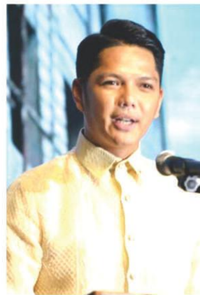
Mayor Kevin Anarna

Sinusulat ang balitang ito, wala pang opisyal na pahayag si Poblete rekomendasyong ng COA na kasuhan siya. /BB