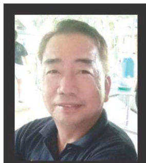
REVANZE by Domz B. CAOILE

Natural na madismaya si Medal of Valor Querubin na sinabi na mga baytani nga ba ng ating bansa ang mga