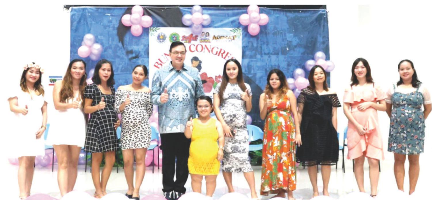
Kalinga sa mga nanay na bagong panganak at may inaalagaang sanggol at mga nagbubuntis ang binigyan ng tulong medikal sa idinaos na Buntis Congress kamakailan sa Lungsod ng Bacoor. Sa larawan, kasama ni Mayor Strike Revilla ang nabiyayaan ng kalingan sa kalusugan na isa sa prioridad ng kanyang administrasyon.