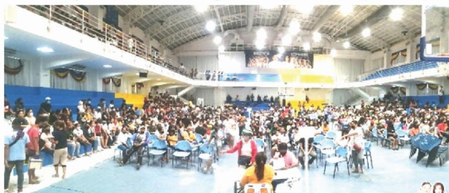
Pamimigay ng educational assistance na ginanap sa Strike Gym sa Bacoor Government Center

"Magpabakuna po kayo sa ating mga vaccination sites at tayo po ay tumatanggap ng walk-in at ng bakuna para sa 1st booster at iba pang tulong medikal," paalaala ni Mayor Revilla.