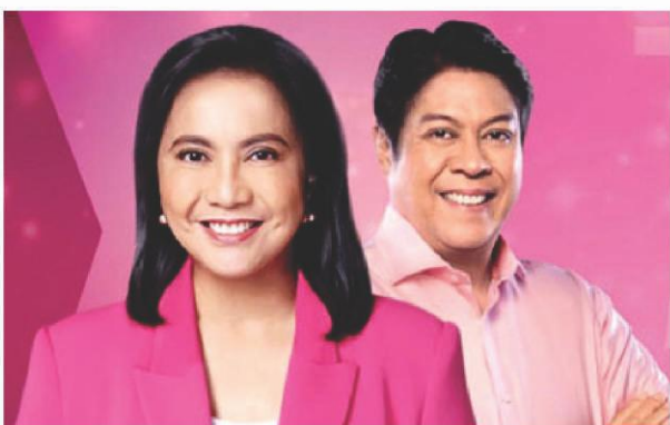
The return of the comeback? Ms. Leni Robredo. Kiko Pangilinan

Pangilinan, who ran for vice president with Robredo, was ranked ninth to 11th place in the senatorial preference