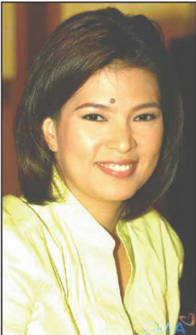
Bacoor City Rep. Lani Mercado-Revilla