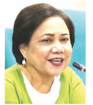
Upang mawala ang galit ni Sen. Cynthia A. Villar, abang wag nyong pakikialaman ang mga ilog niya sa Las Pinas City.

Kaylinaw ng tubig noon sa ilog: maraming isdang dagat ang naliligaw