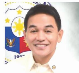
Mayor Eric DL Olivarez

ito dahil naniniwala tayo, mas uunlad ang Paranaque kung malulusog ang ating mamamayan," sabi ni Paranaque City Mayor Eric DL Olivarez -- na dating kinatawan ng lungsod sa Kongreso.