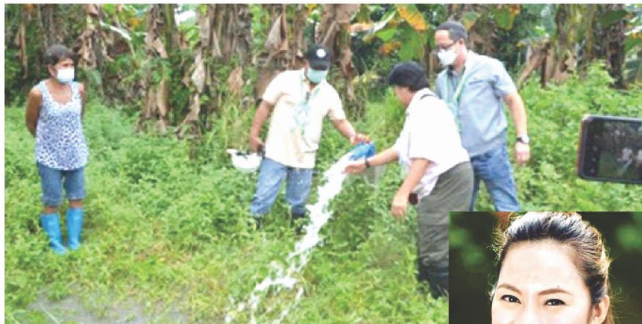
Tubig, malinis na tubigmula sa SPIS sa Barangay Baliwag, Magallanes.