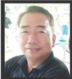
REVANZE by Domz B. CAOILE

Pero may magandang pangyayari naman, kasi nakita ng marami na tama ng vision nina 1st District