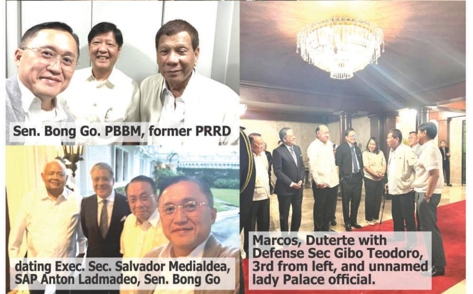
Sen. Bong Go, PBBM, former PRRD