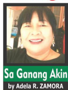
Sa Ganang Akin by Adela R. ZAMORA