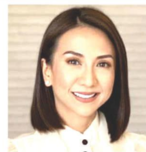
Sec. Christina G. Frasco