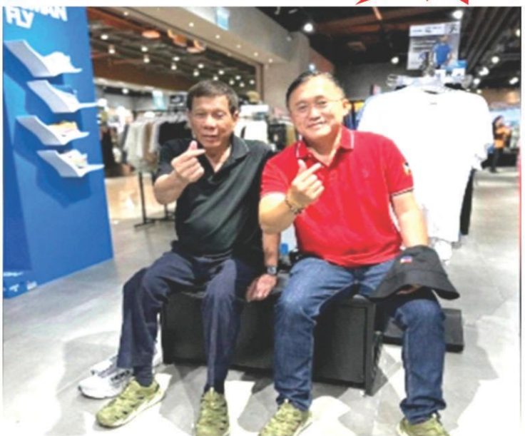
Former President Rodrigo Duterte with Sen. Bong Go. Namasyal, nag-shopping sa Hong Kong. Story, page 2.