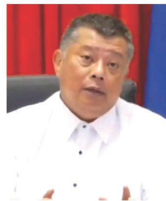
DOJ Sec. REMULLA

We will deeply appreciate your contributions. maraming salamatpo.