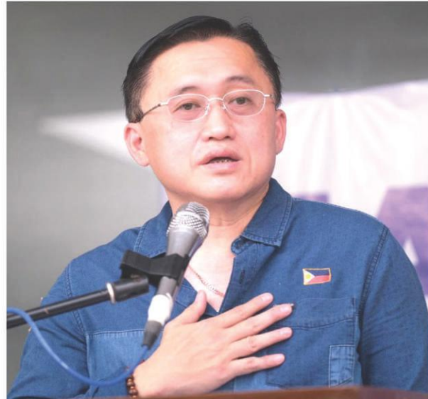
Senator Christopher Lawrence 'Bong' Go

Kung tawagin ko nga siya, siya si Flash Bong Go, at tama lang ito, kasi kaysa mas unahin ang pagtatalumpati sa Senado, agad, pag may nasunugan, andun siya at nag-aabot ng tulong; at kahit saan pang lugar, basta may kalamidad, basta sumisigaw sa paghingi ng tulong ang mga kababayan, nandun siya upang mag-abot ng alalay, ng kailangang-kailangang tulong sa mga binagyo, binaha, naputukan ng bulkan. K u n g m a y