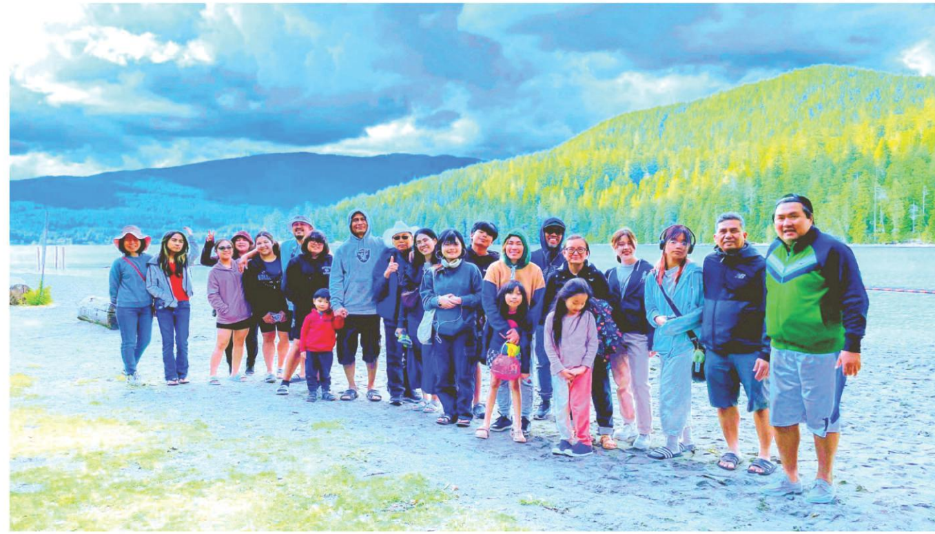
The Clan with the Fathers -- all Andres de Saya-- kasama ang buong dabarkads sa masayang party-party sa Barnett Marine Park.

A picture tells a thousand words, they say, so here's our photos to savor. /IRR