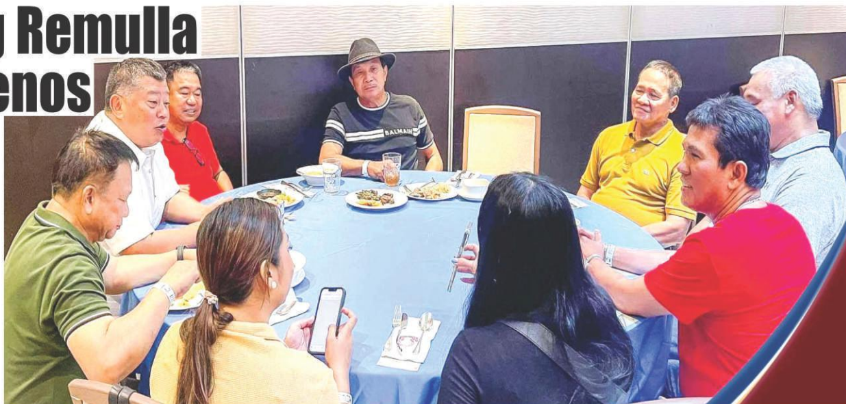
Kumustahan: Justice Sec. Boying Remulla, una sa kaliwa, katabi si Vice Mayor Jun Dualan; sa gitna, Mayor Raffy Dualan at ilang kapitan ng barangay ng Naic.

KUNG nasusunog ang sarili mong bahay, mas uunahin mo bang saklolohan ang kapitbahay mo na nasusunogan din?