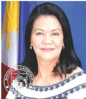
Mayor Dahlia Loyola

Kasi sa ating pagtatanong sa mga taga-Carmona, almost 90 percent ang payag sa coversdion nito, kasi nga,