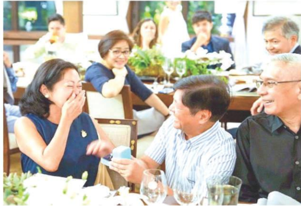
Kailan po Ang second marriage vows? President Marcos hinihiling na pakasalan uli siya ni First Lady Liza Araneta Marcos

Sabi pa sa sulat: "30 years later there is still no place I'd rather be and no person I'd rather be with."