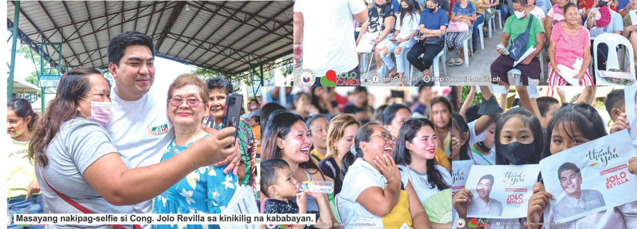
Masayang nakipag-selfie si Cong. Jolo Revilla sa kinikilig na kababayan.