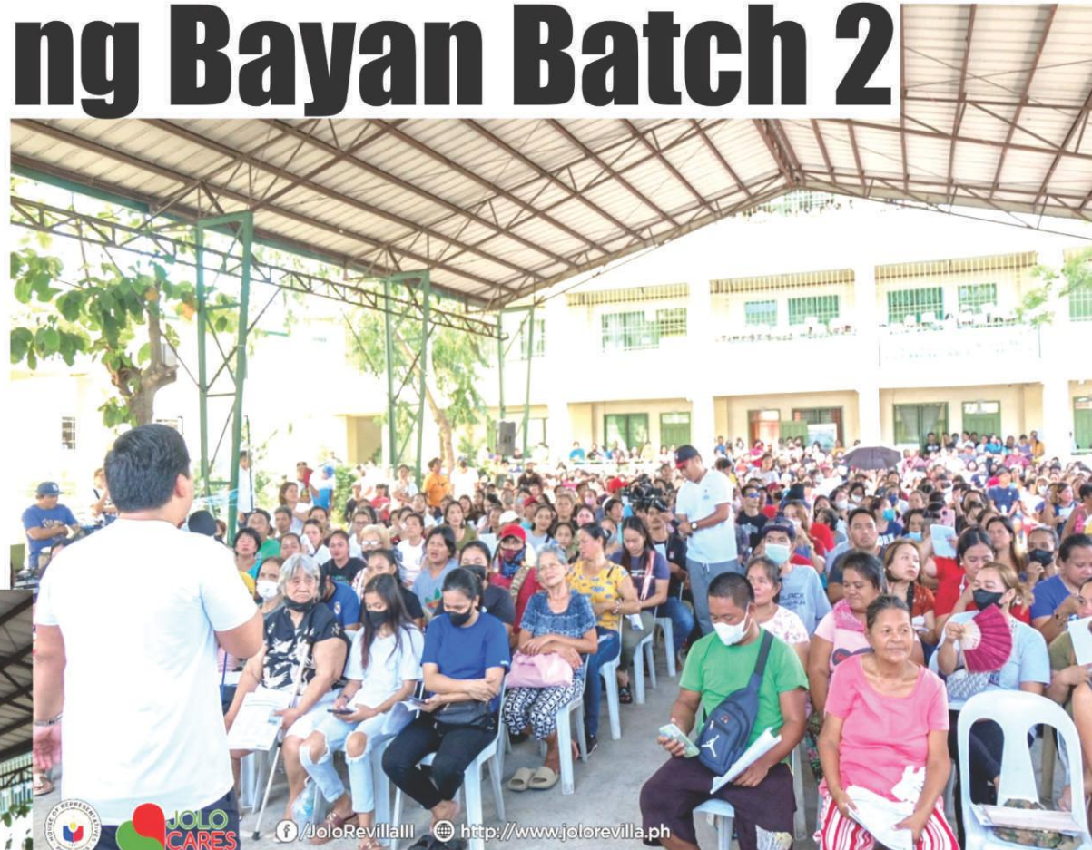
JOLO CARES | JoloRevilla | http://www.jolorevilla.ph