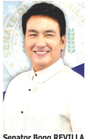
Senator Bong REVILLA