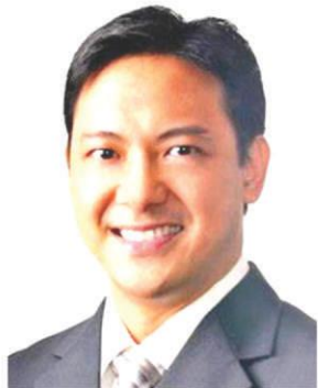
BIR Commissioner Romeo Lumagui Jr.

NAGSAMPA ng kasong tax evasion ang Bureau of Internal Revenue (BIR) sa apat na 'ghost' corporation na nahuling nagbebenta ng mga pekeng resibo sa mga kompanya at tao sa loob ng nakalipas na tatlong taon.