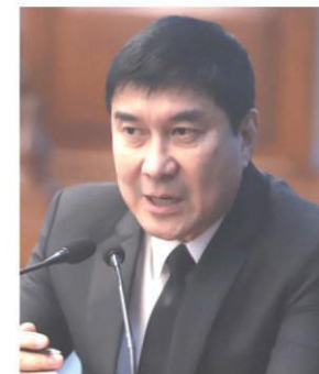
Sen. Raffy TULFO