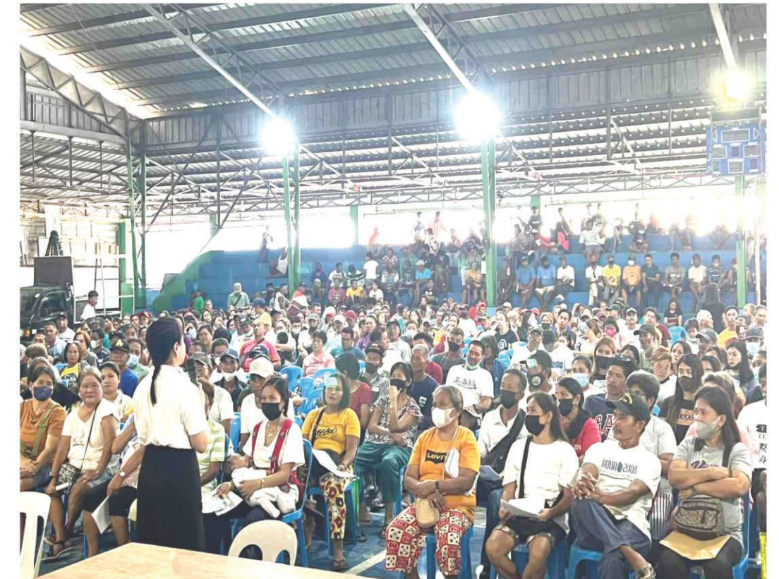
Doctors and health personnel from Gen. Emilio Aguinaldo Memorial Hospital with the help of barangay health workers rendered free medical and dental services to residents of Brgy. San Francisco, Gen. Trias City.

SAN Miguel Corporation (SMC) has rolled out its P500-M "Handog Tulong Pinansyal Para sa Mangingisda" financial assistance program for fisherfolk families residing in Rosario, Tanza, Naic, and Ternate in Cavite.