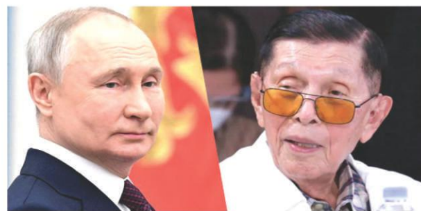
Pres. Vladimir Putin

The ICC warrant now obligates its 123 member states to arrest the Russian leader and extradite him to The Hague for trial if he enters their territory.