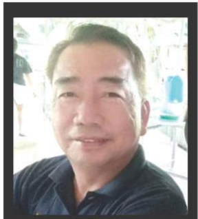
REVANZE by Domz B. CAOILE

Ano'ng ginagawa ng ating Department of Information and Communications Technology (DICT) para