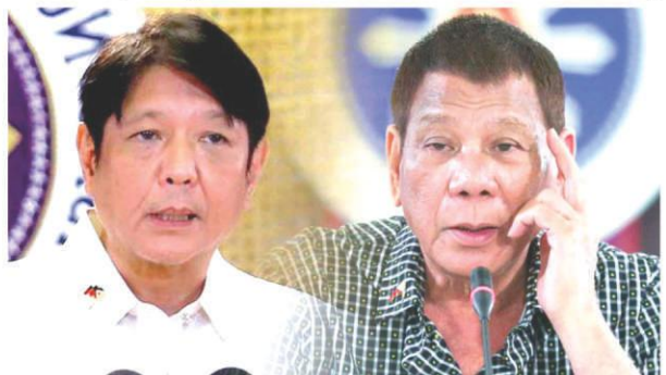
President MARCOS Jr. Former Pres. DUTERTE