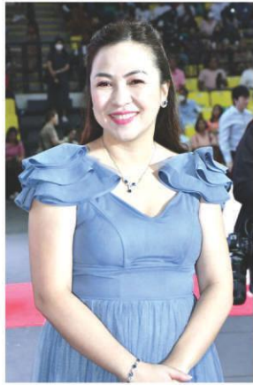
Mayor Jenny BARZAGA

On her social media page, Mayor Barzaga claimed that the said barangays were finally declared drug-free with the cooperation of the Philippine Drug Enforcement Agency