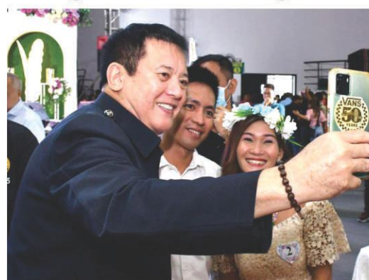
Actor Philip Salvador takes a selfie photo with a newly wed couple