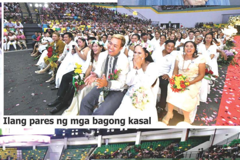
Ilang pares ng mga bagong kasal