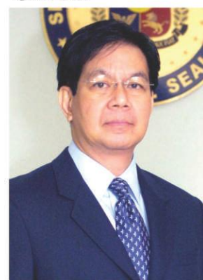
Dating Sen. Ping LACSON

Dahil dito, nagbitiw si Faeldon at itinangging tumanggap siya ng P100 milyong "pasalubong" o "regalo mula sa mga district official at mga bagmen nang maupo siya bilang hepe ng Kawanihan ng Aduana.