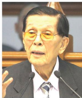
Juan Ponce ENRILE

Aniya pa: "But in terms of eternity, those seemingly long years are but a fleeting moment. Nonetheless, thank you Lord for the years you gifted me; for the protection you blessed me; and for all the blessings you have generously given to me and to my family; and the friends you, Lord, allowed me to have during