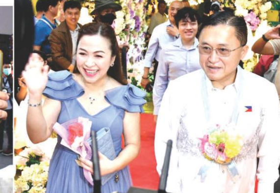
Ninang Mayor Jenny and Ninong Sen. Bong Go