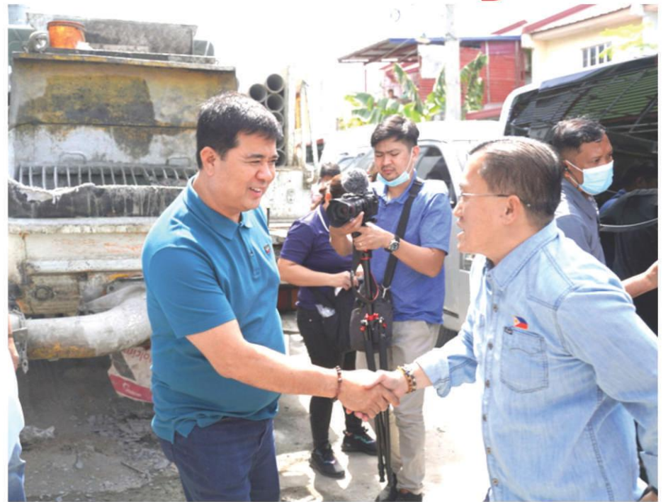
Mayor AA welcomes Sen. Bong Go during his visit at the construction site of Super Health Center in Imus City.

Para sa inyong komento, eto po: domzcaiole@yahoo.com