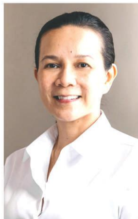
Senator Grace POE

NAIA, galaw-galaw at aksyong totoo, hala, 'wag antayin na magalit si Sen. Grace Poe, kayo rin.