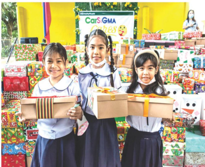
"Thank, thank you po, ambabait nyo po, thank you."