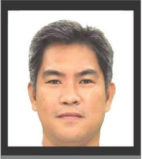
THE PUBLISHER by Henry E. CAOILE

Kaya mga History teacher, ano ang inyong itinuturo sa inyong mga estudyante -- TMC ba o Imus ang provincial capital ng Cavite.