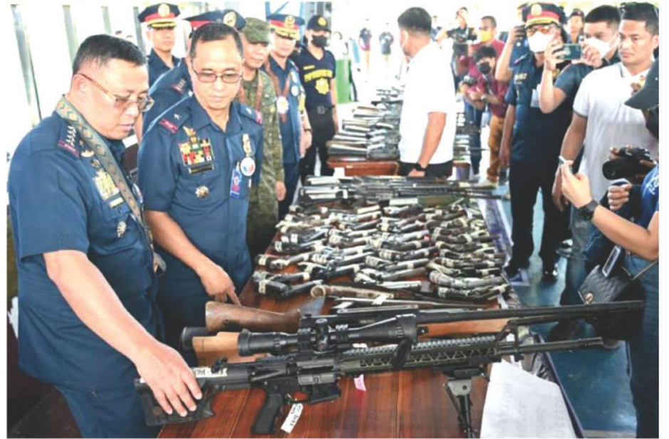
PNP chief Rodolfo Azurin Jr. inspects the confiscated 684 firearms

The grounds for revocation include involvement of the gun owners in any violation of laws like illegal drugs, illegal gambling, commission or pendency of a crime involving firearms and ammunition, prolonged non-renewal of a firearms license, illegal or unlawful transfer of firearms, violation of the election gun ban, revoked by order of the court, and misrepresentation or submission of spurious supporting documents.