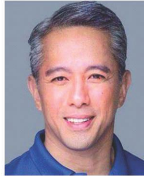
Gov. Juanito Victor C. Remulla Jr.

Noong magka-eleksiyon ng 1987, nanalo uling governor ang tatay ni Gov. JonVic Remulla at