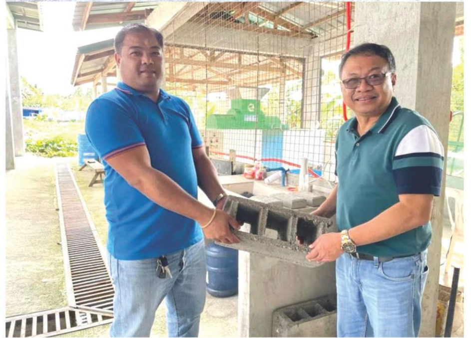
Matibay na hallow block, ipinapakita ni Mayor Redel John Bawalan Dionisio (kanan).