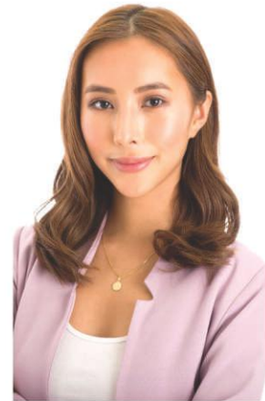
8th District Representative Aniela Tolentino

Mabigat na trabaho itong paglilinis, kasi kailangang hindi lamang probable cause kungdi matitibay na ebidensiya