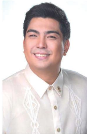
1st District Representative Jolo Revilla

VOLUME 1 NO. 14 10.00 JANUARY 2 - 8, 2023