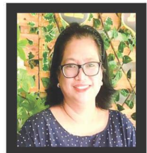
AY, BUHAY by Liza Fe BONETE

Pero matapos ang holidays, ano na: ubos ang konting naipon, tinanggap na 13th month pay, at mga