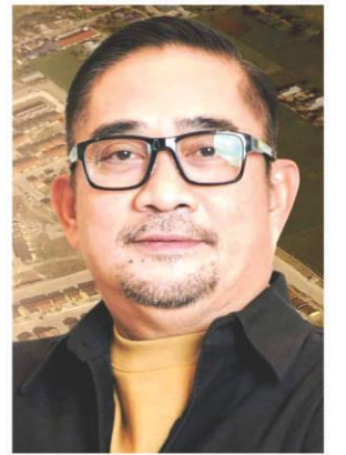
Nuewa Ecija Governor Oyie Umali

Sa kanyang Facebook page, nanawagan si NE Gov. Aurelio 'Oyie' Umali sa mga LGUs, lalo na sa city and municipal sanggunian na ingatan ang basta pagbibigay ng exemption and permit sa land conversion para gawing