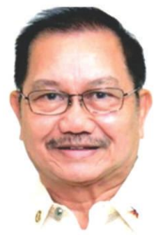
Former Agri Sec. Manny Piñol

"xxx kundi halaga ng pananim at Manok Pinoy breeders na naparami ko at inilagay sa Tax Returns kasi