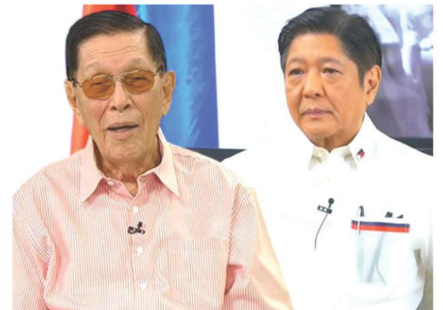
Former Senator ENRILE at Pres. Bongbong MARCOS

Pangulo: kuhanin ang P275-B MIF sa panukalang P5.268-Trillion national budget for 2023.