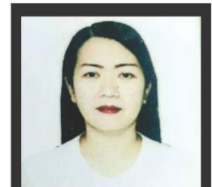
SA TOTOO LANG! by GENE T. TAN

In relation to this, nanawagan ako sa ating regular Cavite congressman and one