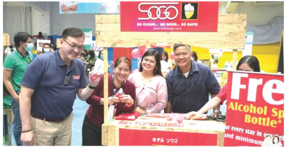
Mabuhay ang mga negosyanteng Bacooreno: Ang kasayahan at panunumpa ng mg opisyal ng Bacoor Chamber of commerce ay pinasaya ni Mayor Strike B. Revilla (dulong kaliwa).

Ang mass oahhtaking, siyempre ay pinamunuan ni Mayor Strike B. Revilla na inilahad ang mga programa ng kanyang administrasyon upang mas mapasigla ang pagnenegosyo sa lungsod, lalo na nga at ngayon ay unti-unting bumabangon