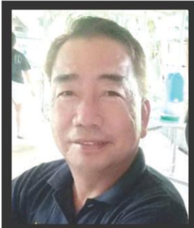
REVANZE by Domz B. CAOILE

Kamakailan, naging successful ang ginanap na Super STRIKE Christmas party na naging mass oahhtaking ng mga opisyal ng Business Associations of the City of Bacoor.