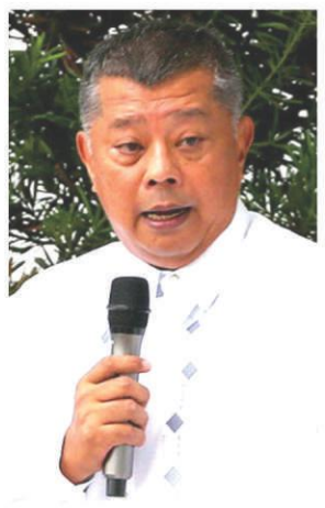
Justice Secretary Jesus Crispin 'Boying' Remulla