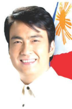
Senator Bong REVILLA

Eniwey, magandang panukala, e pumasa kaya ang nais ni Sen. Revilla... sana po!