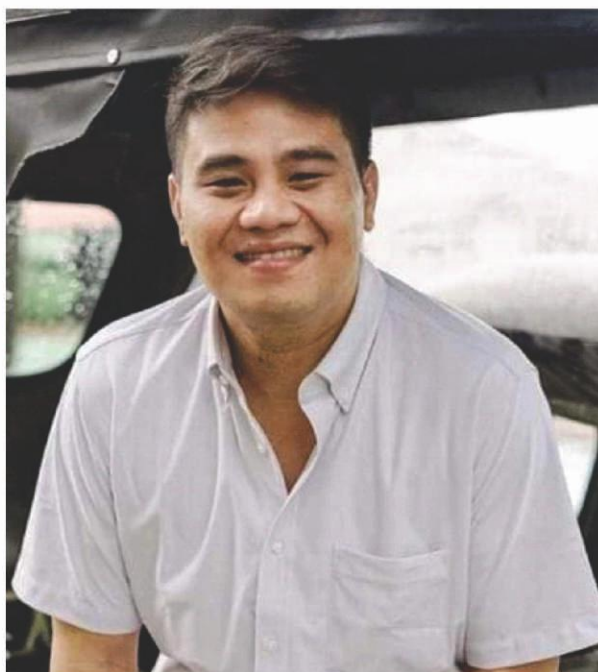
The Best Father to Kawitenos!

anchored his candidacy on the platform on health and social services, economy and infrastructure.