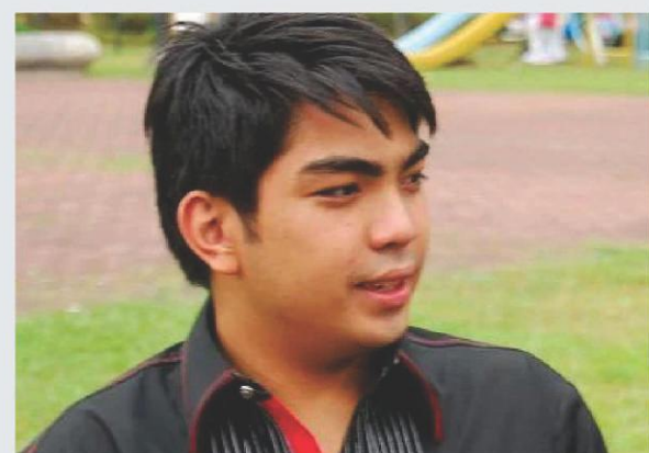
Cong. Jolo Revilla: Konting tiis lamang po,...

Sabi nga nila, mas nakamamatay ang libo-libong pisong bayad sa operasyon, doctor's fee at hospitalization at iba