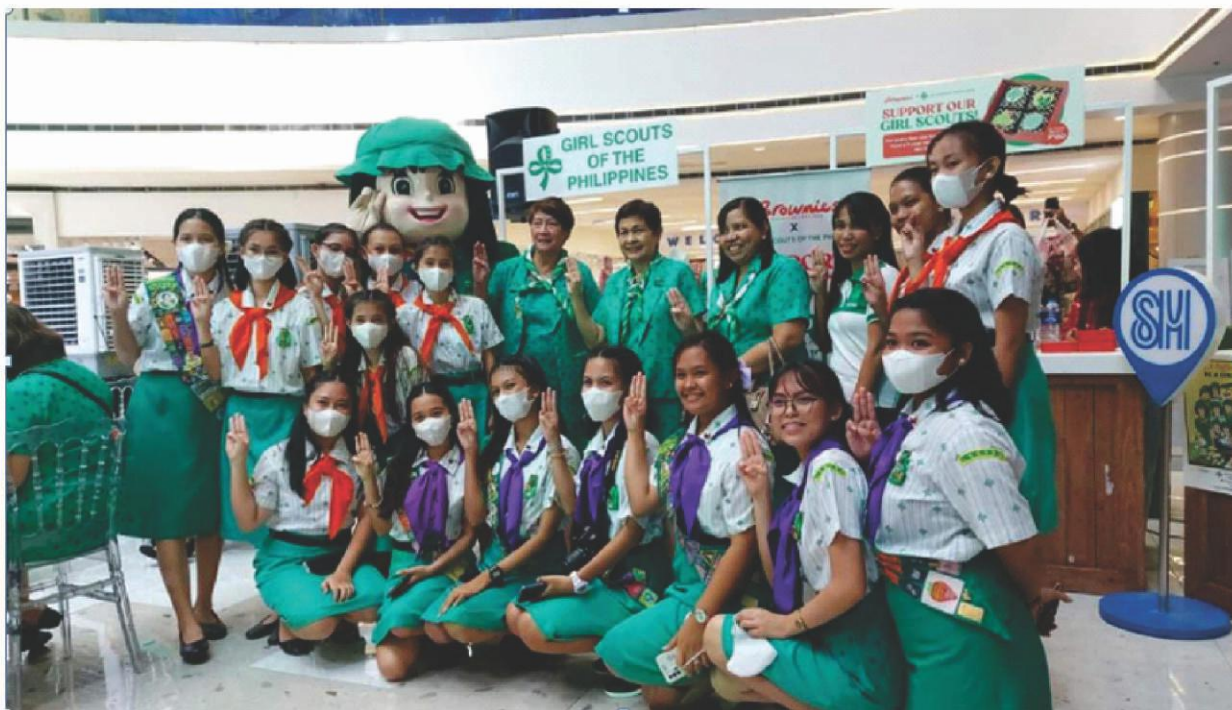
GSP BROWNIES. Kapartner ang SM Supermalls at Brownies Unlimited, iniarangkada ng Girl Scouts of the Philippines ang s GSP-themed brownies simula Set. 16 hanggang Disyembre 15, 2022.

Bisitahin at sipatin lamang ang at ang @smsupermalls sa lahat ng social media accounts nito upang makita ang iba pang kapartner at mabibiyaan ng kampanyang '100 Days of Happiness'..