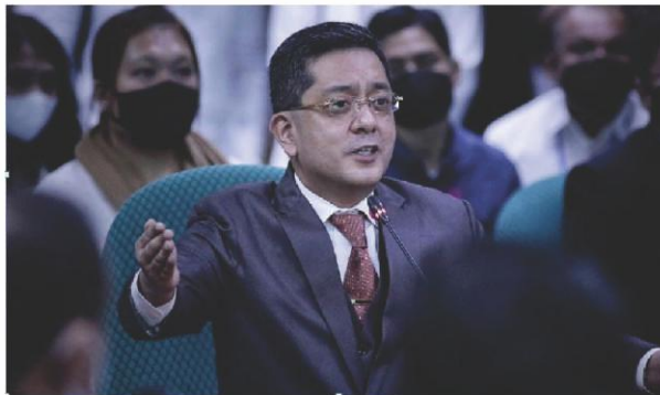
COMELEC Chief George Garcia: Tuloy kami sa paghahanda sa eleksiyon.

masasasyang, sabi pa ni Garcia ang mga supply at iba panggamit sa eleksiyon na bibilhin ng Comelec para sa botohan sa Disyembre kahit na ipagpaliban ang botohan sa ibang petsa.