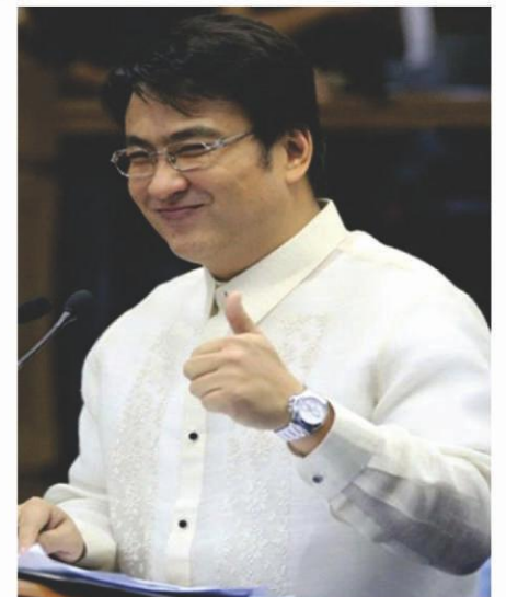
Salamat po sa malasakit, Sen. Bong Revilla