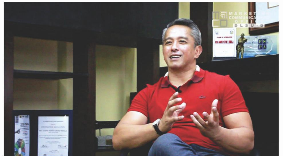
LOCAL PPP Code sinunod sa alok ng SMC: Gov. JonVic Remulla