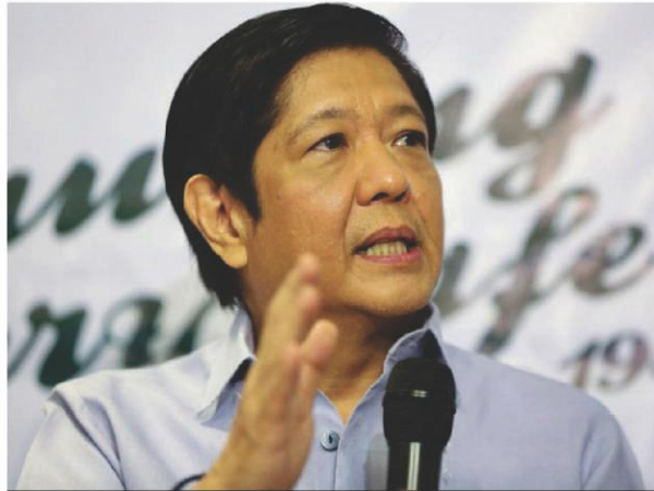
MARCOS: "We will support and protect the rights of media..."

Marcos said that under his lead, the national government "will support and protect the rights of the media as they efficiently